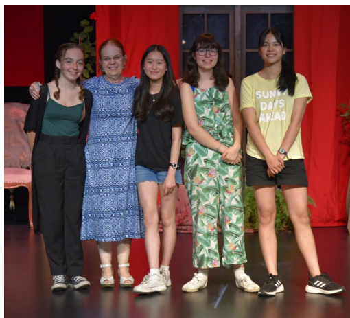
12 juin - Cérémonie de remise des certificats de reconnaissance

Ils ont compris que lire est la recette gagnante pour réussir dans tout projet éducatif. AS