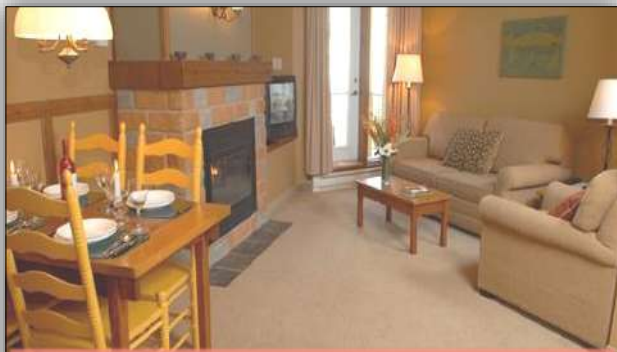
Studios de 4 à 6 personnes