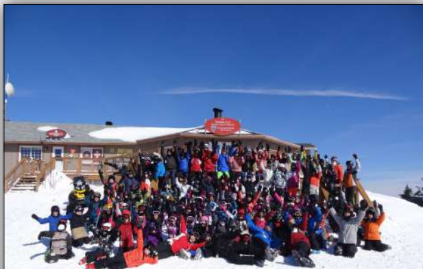
Groupe AVJ au sommet