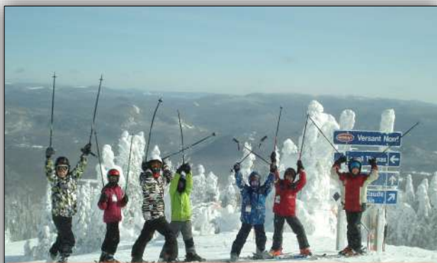
Le ski plaisir en action !