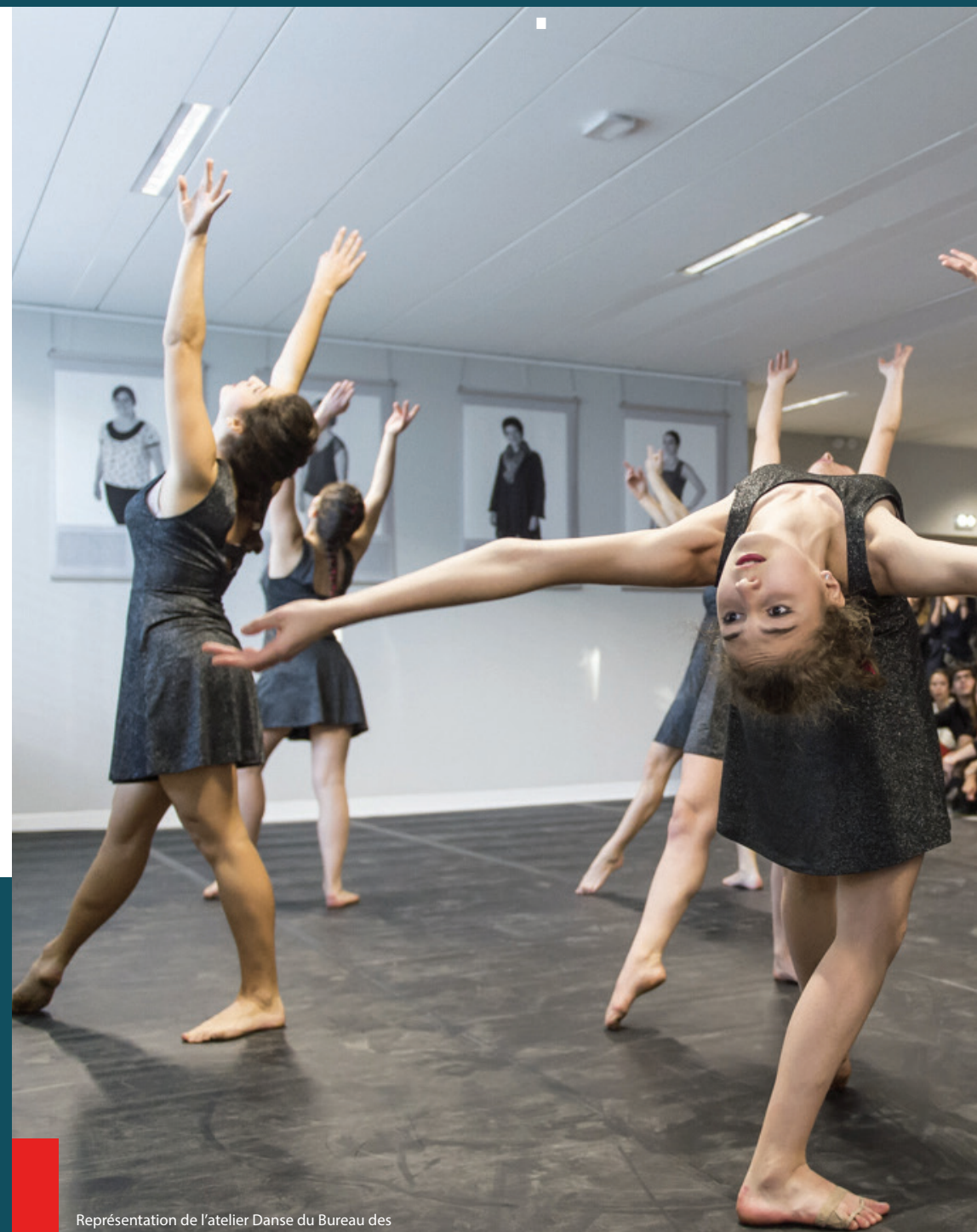
Représentation de l'atelier Danse du Bureau des Arts le jour de l'inauguration du nouvel Institut en décembre 2016.

Les lauréats aux épreuves d'entrée devront justifier du niveau requis au moment de leur inscription administrative à Sciences Po Bordeaux. Il n'est pas nécessaire d'être déjà en possession des titres exigés pour se présenter aux épreuves d'entrée.