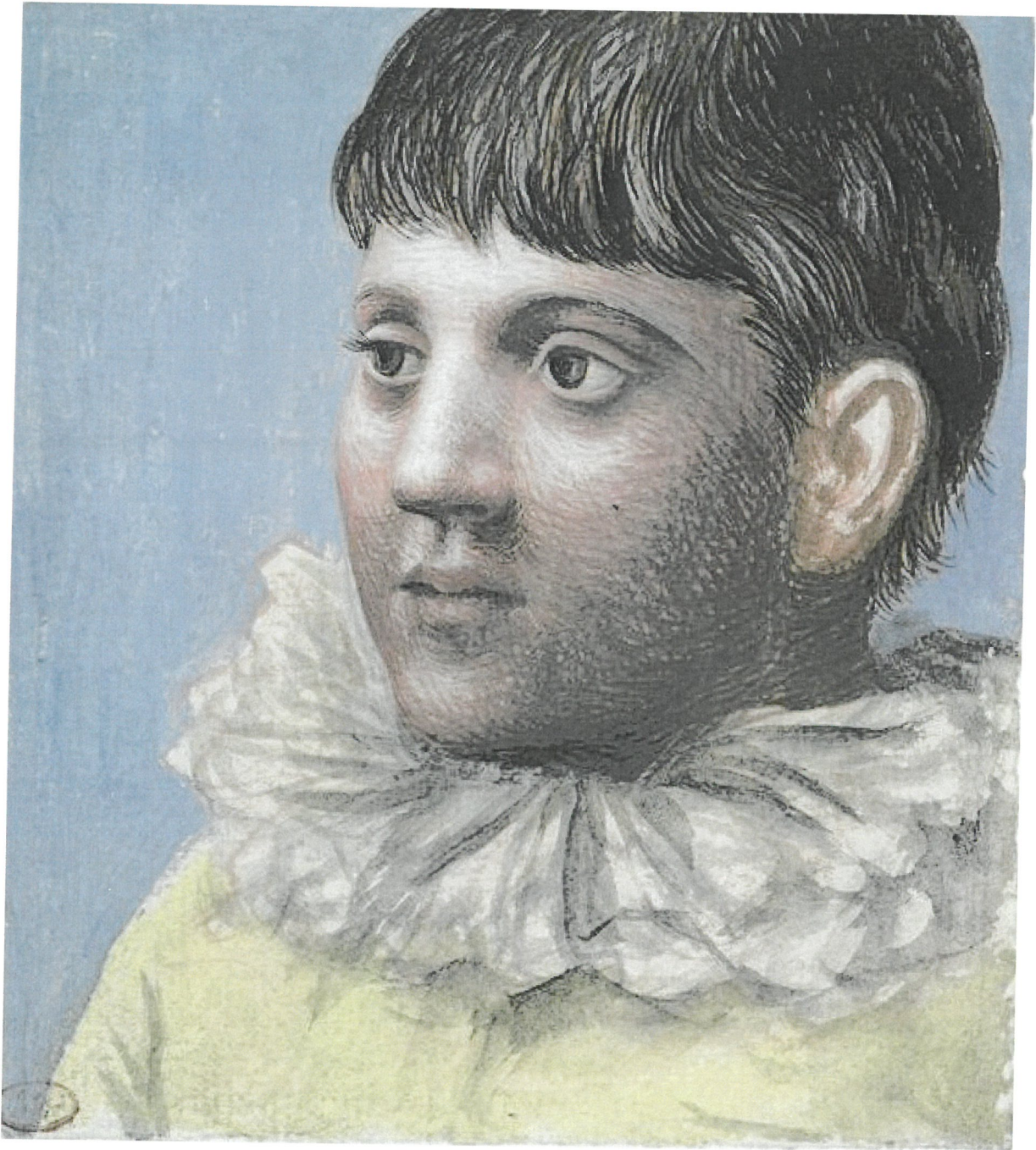
Pablo Picasso, Portrait d'adolescent en Pierrot , 1922, aquarelle-gouache-verg , 11,8 x 10,5 cm, Mus e Picasso, Paris.