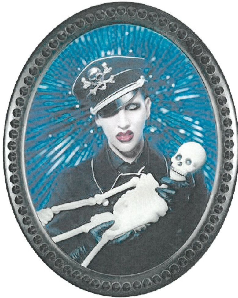
Pierre et Gilles, The Dead Song (La chanson de la mort) , 2004, photographie peinte, pièce unique, 125,1 x 103,7 cm, collection privée, Paris.