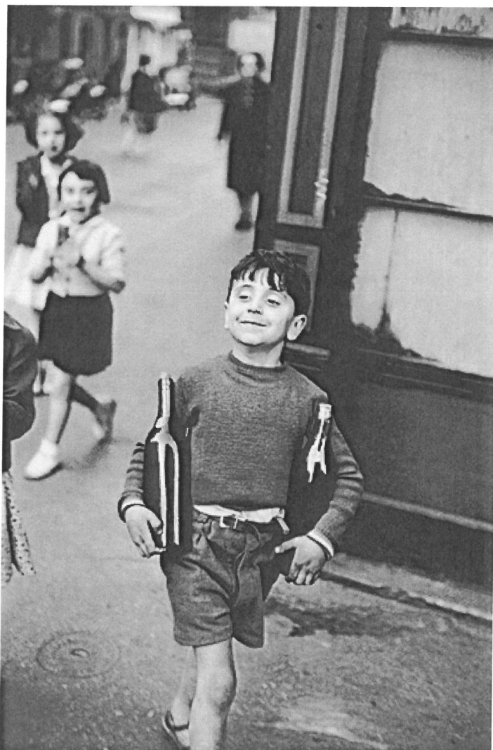
Henri Cartier-Bresson, Rue Mouffetard, Paris , 1958, gélatine d'argent, 37,2 x 25,1 cm, Collection Gruber, Museum Ludwig, Cologne.