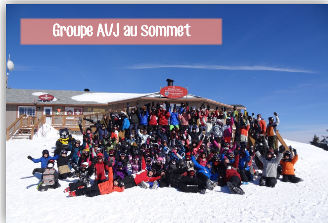
Groupe AVJ au sommet