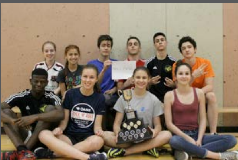
AS Tuche de Monaco (catégorie lycée)

Félicitations à tous les participants! Espérant vous revoir l'an prochain.