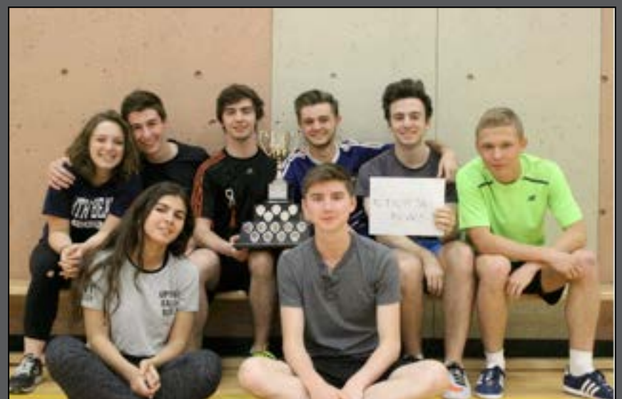
Team panda (catégorie 4e et 3e)