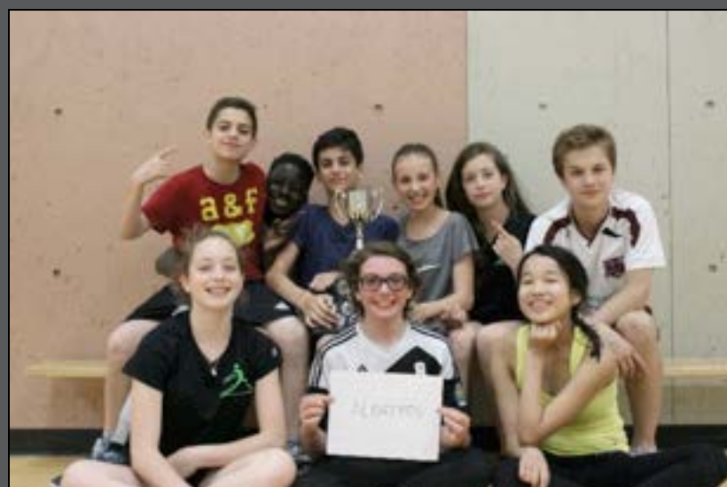
Albatros (catégorie 6e et 5e)