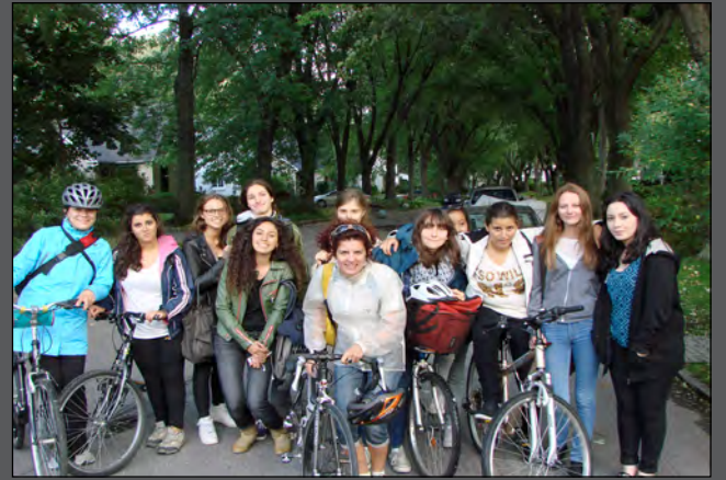
Le groupe d'HIDA à la cité du Tricentenaire

Le cours d'Histoire des arts, que le Collège propose en option de la Seconde à la Terminale, permet à nos étudiants d'enrichir leur culture artistique. D'abord chronologique en Seconde, le programme devient plus thématique. Ainsi, un des sujets abordés en Terminale s'intitule La ville satellite, des cités-jardins aux éco-quartiers ou Comment les architectes et les urbanistes conçoivent le lien entre la nature et la ville depuis l'industrialisation ?