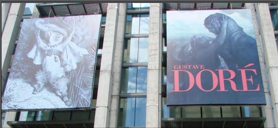
Les affiches de l'exposition Gustave Doré, L'imaginaire au pouvoir