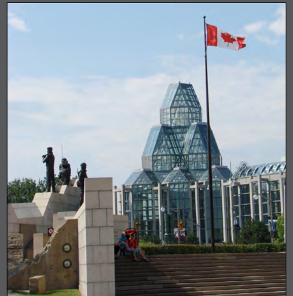
Le musée des Beaux-Arts d'Ottawa, œuvre de Moshé Safdie