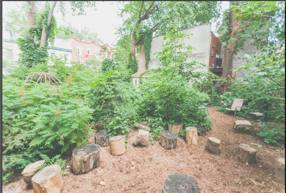
Le jardin cultures amérindiennes de Sentier urbain

Les étudiants d'HIDA ont donc pu découvrir cette approche urbanistique récente en allant à la rencontre, le 25 septembre, de Sentier urbain , un organisme de «verdissement social» puis en se promenant dans les Habitations Jeanne-Mance , un quartier qui a d'abord été conçu autour de valeurs sociales et qui connaît aujourd'hui une revitalisation autour de valeurs environnementales et artistiques.