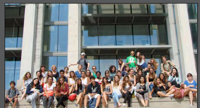
Le groupe d'HIDA et de 1ère L devant le musée

Cette journée enrichissante a permis aux étudiants d'échanger et de partager leur intérêt pour l'art. D'autres visites, au cours de l'année, les conduiront à découvrir de nombreux courants artistiques, ainsi que différentes approches de l'art, à travers la peinture bien sûr, mais aussi l'architecture, l'urbanisme ou la musique par exemple.