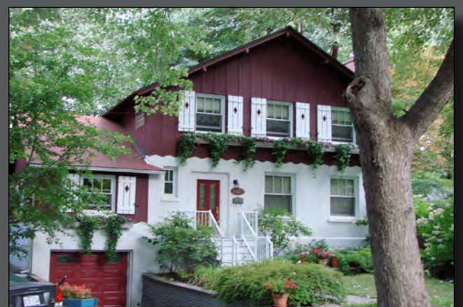
Le chalet suisse de la cité du Tricentenaire

- la cité du Tricentenaire : directement inspirée du modèle cité-jardin d'Ebenezer Howard, cette cité sise à l'est du parc Maisonneuve a été construite en 1942, pour le tricentenaire de Montréal. L'objectif de ses concepteurs était de fournir aux ouvriers francophones un cadre de vie verdoyant, loin de la pollution des usines et des lieux de dépravation des quartiers ouvriers. Ainsi, les architectes proposent deux types de maison : le chalet suisse et la maison canadienne, facilement reconnaissables. Finalement, cette cité ne fut jamais occupée par des ouvriers ! Elle demeure, encore aujourd'hui, un secret bien gardé, accessible pour une classe moyenne supérieure qui préserve les aménagements originels.