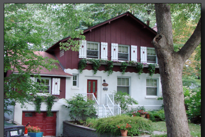
Le chalet suisse de la cité du Tricentenaire

- la cité du Tricentenaire : directement inspirée du modèle cité-jardin d'Ebenezer Howard, cette cité sise à l'est du parc Maisonneuve a été construite en 1942, pour le tricentenaire de Montréal. L'objectif de ses concepteurs était de fournir aux ouvriers francophones un cadre de vie verdoyant, loin de la pollution des usines et des lieux de dépravation des quartiers ouvriers. Ainsi, les architectes proposent deux types de maison : le chalet suisse et la maison canadienne, facilement reconnaissables. Finalement, cette cité ne fut jamais occupée par des ouvriers ! Elle demeure, encore aujourd'hui, un secret bien gardé, accessible pour une classe moyenne supérieure qui préserve les aménagements originels.