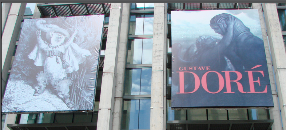
Les affiches de l'exposition Gustave Doré, L'imaginaire au pouvoir

L'exposition a aussi permis aux étudiants de découvrir que Doré est également un sculpteur, un peintre, un aquarelliste. Surtout, l'exposition a mis l'accent sur l'influence qu'a eue Gustave Doré sur les XXème et XXIème siècles, particulièrement sur le cinéma. La démonstration est convaincante : de courtes vidéos mettent en parallèle des gravures de Doré avec King-Kong (Merian C. Cooper et Ernest B. Schoedsack, 1933), Faust (Friedrich Wilhelm Murnau, 1926), La Belle et la Bête (Jean Cocteau, 1946), jusqu'à Shrek 2 (Andrew Adamson, Kelly Asbury et Conrad Vernon, 2004) ou encore Le Seigneur des Anneaux (Peter Jackson, 2001, 2002 et 2003). Au sortir de l'exposition, beaucoup d'entre nous se posaient la question : que serait le cinéma sans l'influence de Gustave Doré ?!