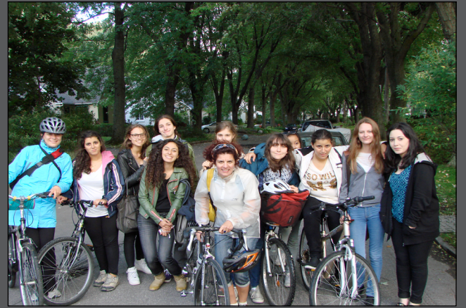
Le groupe d'HIDA à la cité du Tricentenaire

Le cours d'Histoire des arts, que le Collège propose en option de la Seconde à la Terminale, permet à nos étudiants d'enrichir leur culture artistique. D'abord chronologique en Seconde, le programme devient plus thématique. Ainsi, un des sujets abordés en Terminale s'intitule La ville satellite, des cités-jardins aux éco-quartiers ou Comment les architectes et les urbanistes conçoivent le lien entre la nature et la ville depuis l'industrialisation ?