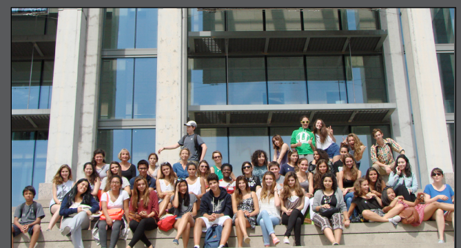
Le groupe d'HIDA et de 1ère L devant le musée

Cette journée enrichissante a permis aux étudiants d'échanger et de partager leur intérêt pour l'art. D'autres visites, au cours de l'année, les conduiront à découvrir de nombreux courants artistiques, ainsi que différentes approches de l'art, à travers la peinture bien sûr, mais aussi l'architecture, l'urbanisme ou la musique par exemple.